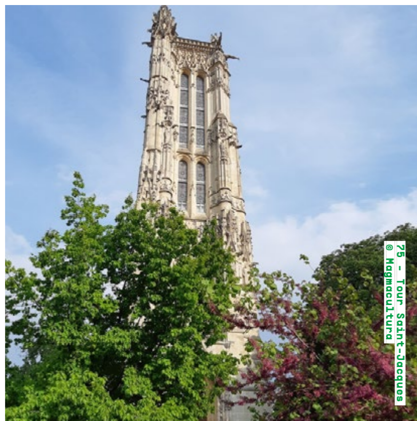
75 - Tour Saint-Jacques