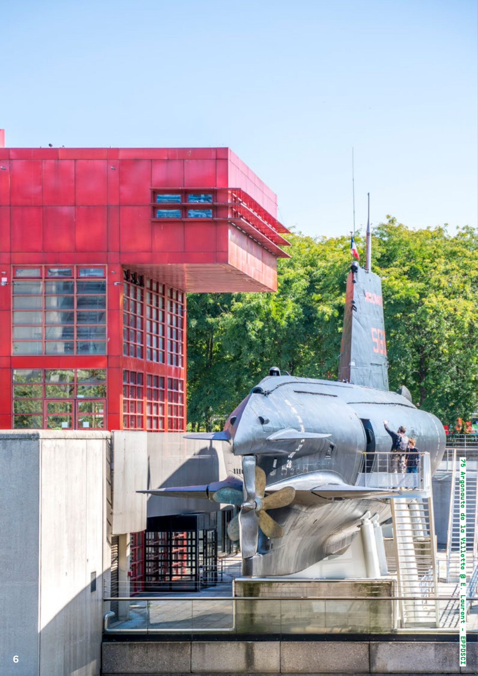
75 Argonaute de la Villedieu