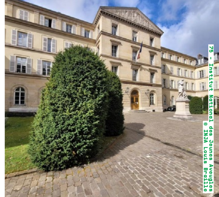
75 - Institut National des Jeunes Aveugles @ INJA Louis Braille

Visites guidées samedi et dimanche de 14h30 à 16h (sur inscription) seine-saintgermain.fr Détails de la programmation ici