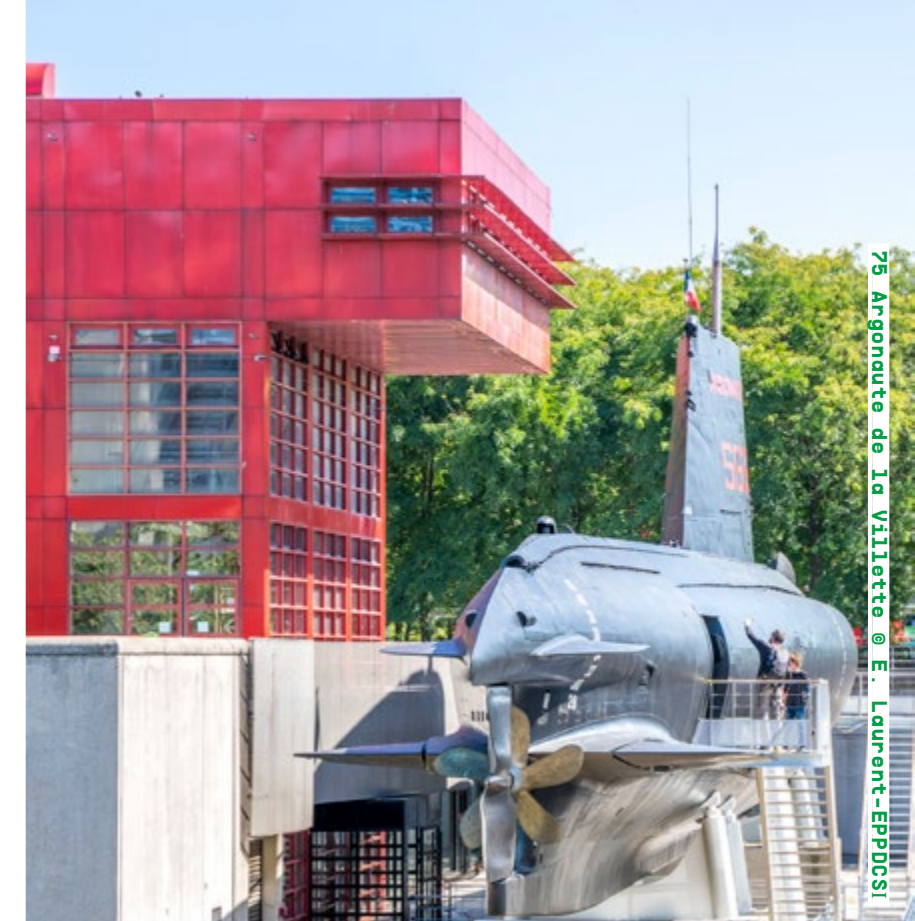
75 Argonaute de la Villette

Visites samedi de 10h à 18h et dimanche de 10h à 19h cite-sciences.fr Détails de la programmation ici