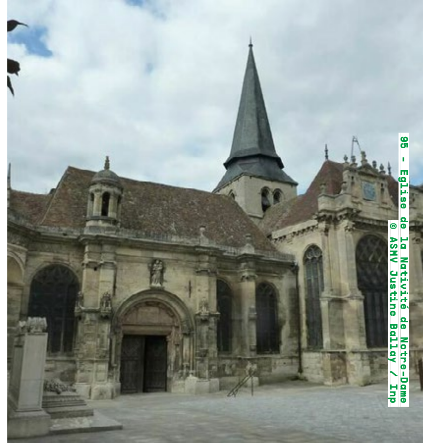
95 - Église de la Nativité de Notre-Dame @ ASMV Justine Bailly / Imp

Visites commentées dimanche de 14h à 18h (sur inscription) beaumontsuroise.fr Détails de la programmation ici