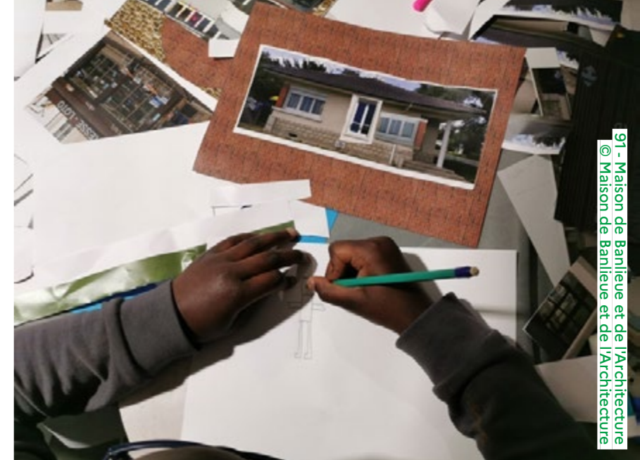
91 - Maison de Banlieue et de l'Architecture

Visite et atelier dimanche de 14h30 à 16h30 (sur inscription) seine-saintgermain.fr Détails de la programmation ici