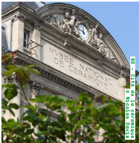
92 - Cité de la céramique

Performance samedi de 15h à 15h30 musee.meudon.fr Détails de la programmation ici