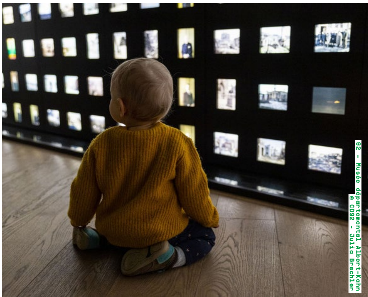
92 - Musée départemental Albert-Kahn

Visite commentée samedi de 10h15 à 11h (sur inscription) albert-kahn.hauts-de-seine.fr Détails de la programmation ici