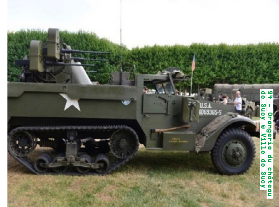
94 - Orangerie du château de Sucy

Visites commentées samedi et dimanche de 11h30 à 17h20 (sur inscription) museeairespace.fr Détails de la programmation ici