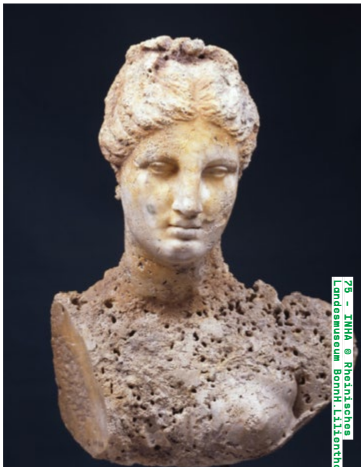
75 - INHA @ Rheinisches Landesmuseum Bonn. Lillienth

Conférence samedi de 17h45 à 19h inha.fr Détails de la programmation ici