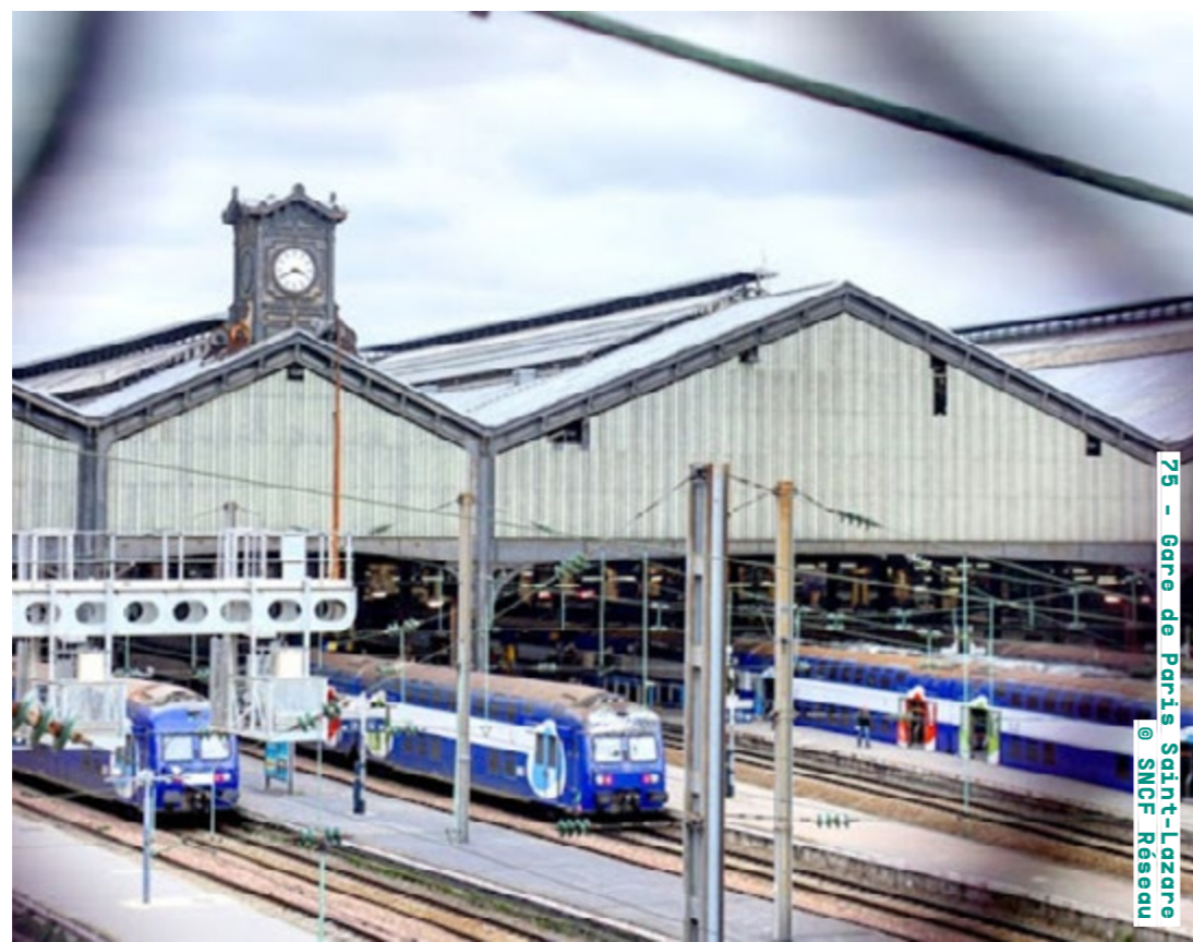
75 - Gare de Paris Saint-Lazare @ SNCF Réseau

Toute la programmation à retrouver sur ratp.fr/jep