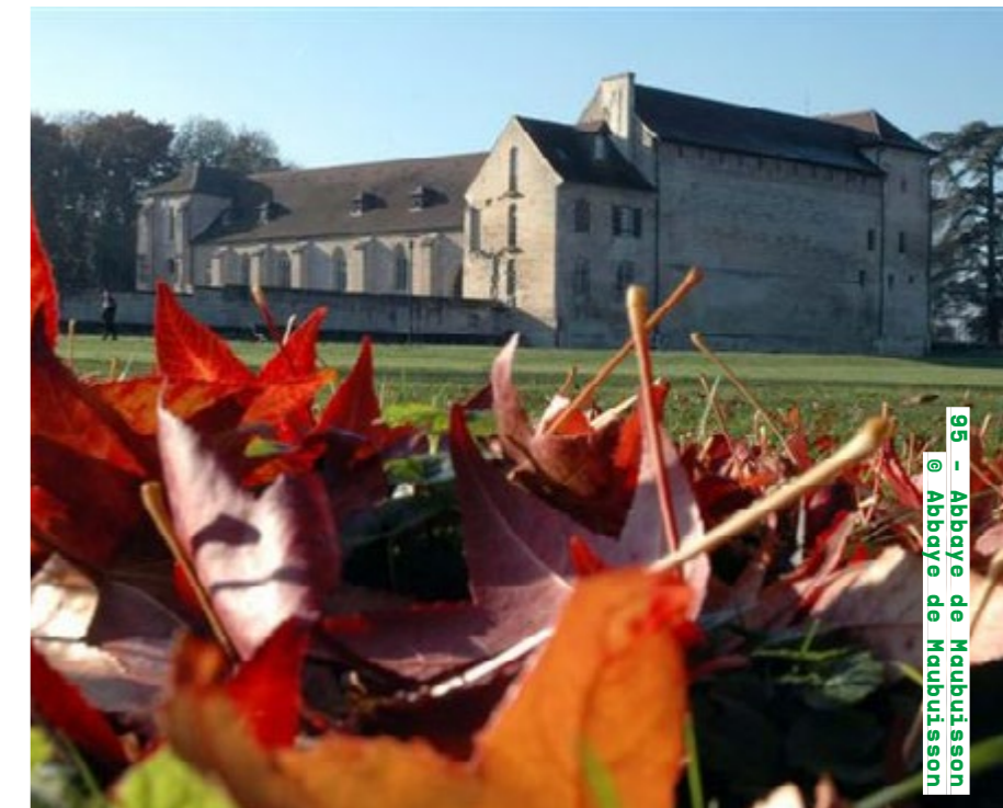
95 - Abbaye de Maubuisson @ Abbaye de Maubuisson

Visites guidées samedi et dimanche de 14h à 14h30, de 15h à 15h30, de 16h à 16h30 et de 17h à 17h30 (inscription sur place) ville-montmorency.fr Détails de la programmation ici