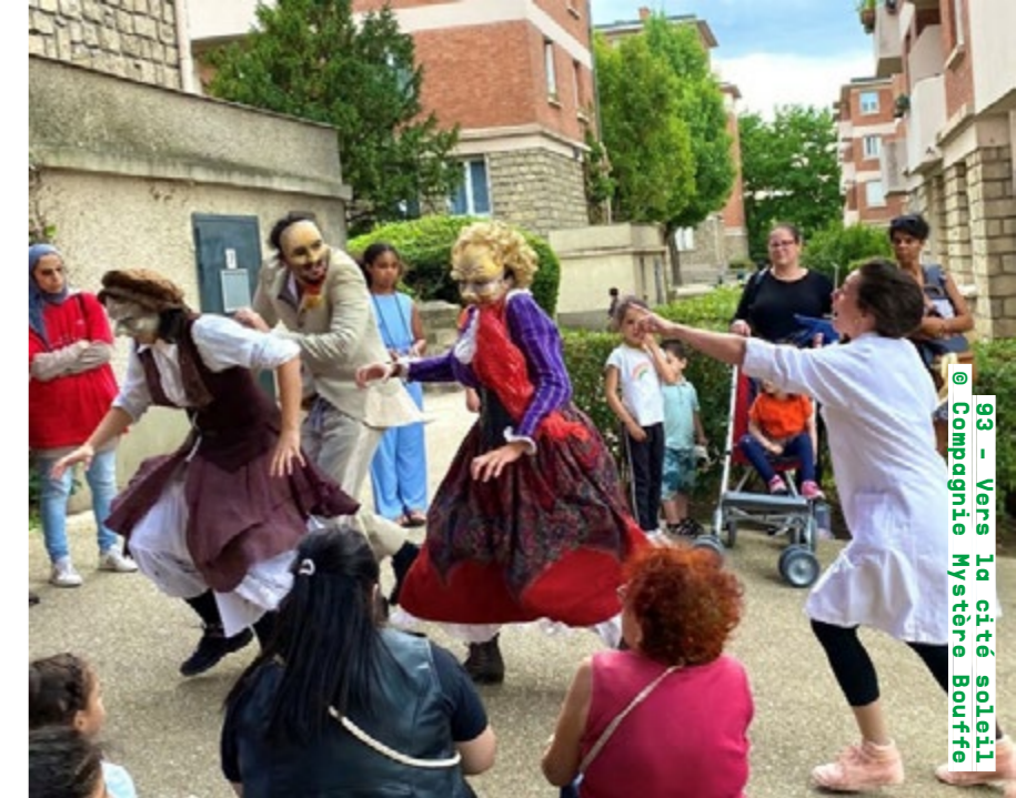
93 - Vers la cité soleil @ Compagnie Mystère Bouffes