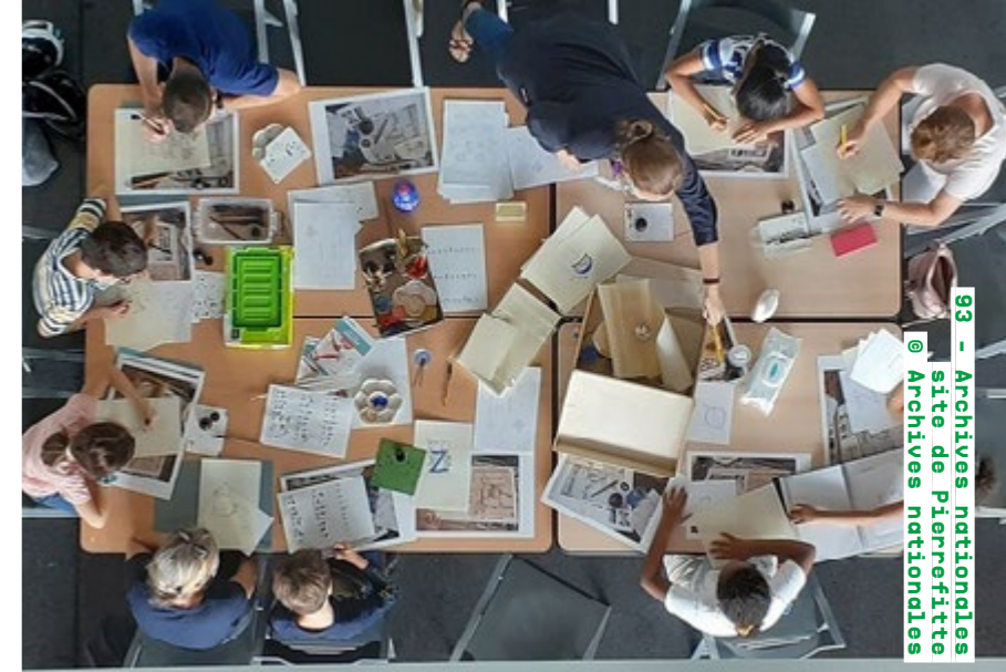
93 - Archives nationales site de Pierrefitte

Ateliers samedi de 14h à 18h macval.fr Détails de la programmation ici