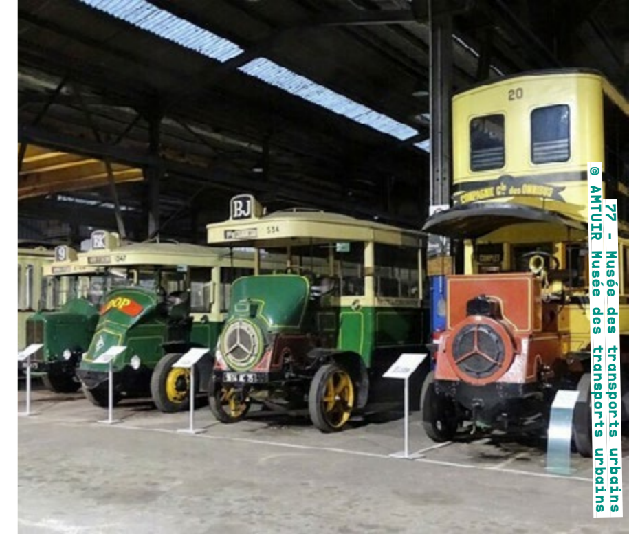
77 - Musée des transports urbains @ AMTUIR Musée des transports urbains

Exposition samedi et dimanche de 10h à 18h univem-paris.com Détails de la programmation ici