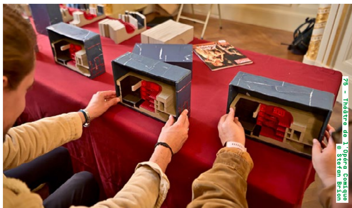
75 - Théâtre de l'Opéra Comique

Visite samedi de 10h30 à 11h30 (sur inscription), archives-nationales.culture.gouv.fr Détails de la programmation ici