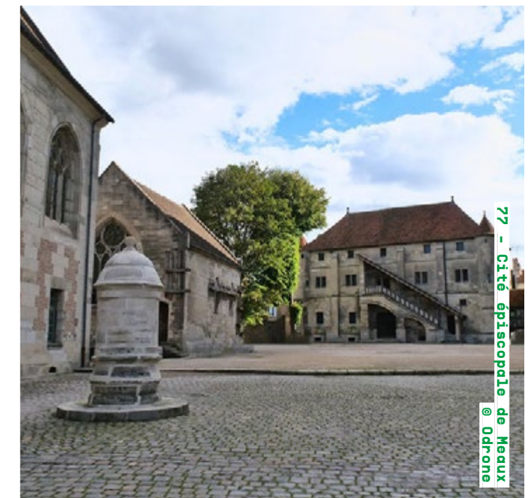
77 - Cité épiscopale de Meaux @ Odrone

Visites libres samedi de 10h à 17h et dimanche de 10h à 16h (sur inscription) tourisme-pvm.fr Détails de la programmation ici