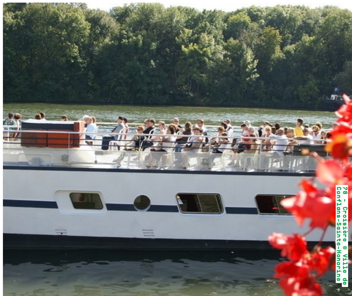
78 - Croisière