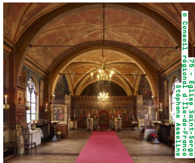
75 - Église Saint-Serge

Visites commentées samedi de 15h à 17h et dimanche de 16h à 17h Concert dimanche de 15h à 16h saint-serge.fr Détails de la programmation ici