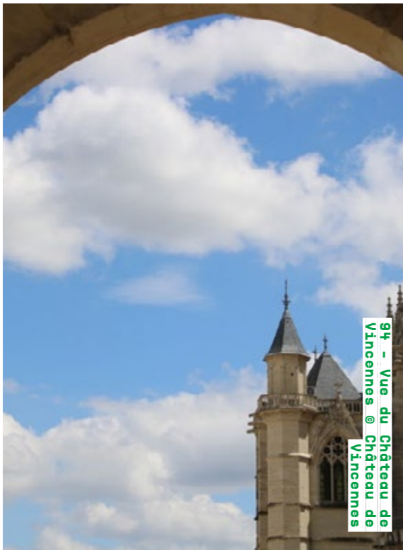
94 - Vue du Château de Vincennes @ Vincennes

Visite commentée dimanche de 10h à 11h (sur inscription) Tarif : 10€, tarif jeune (moins de 16 ans) : 5€, gratuité : moins de 7 ans domainedegrosbois.com Détails de la programmation ici