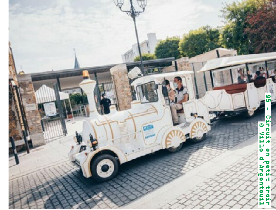
95 - Circuit en petit train @ Ville d'Argenteuil