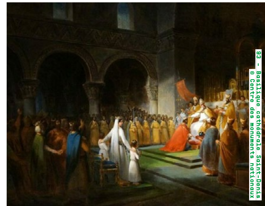
93 - Basilique cathédrale Saint-Denis @ Centre des monuments nationaux

Visites commentées samedi de 10h à 17h30 et dimanche de 12h à 17h30 (inscription sur place) saint-denis-basilique.fr Détails de la programmation ici