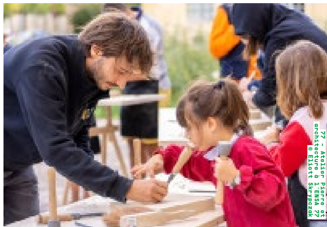
77 - Atelier Pierre et architecture à l'ENSA 77

Les Journées nationales de l'architecture ont vocation à fédérer les initiatives qui contribuent à la découverte de l'architecture et de ses métiers auprès de tous les publics. Elles visent à révéler la présence de l'architecture dans tous les territoires, qu'il s'agisse de grands projets ou de constructions du quotidien.