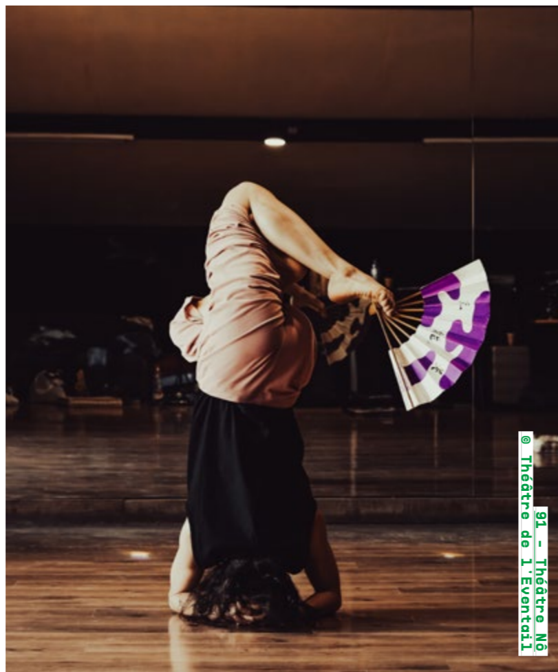
91 - Théâtre Nô @ Théâtre de l'Éventail