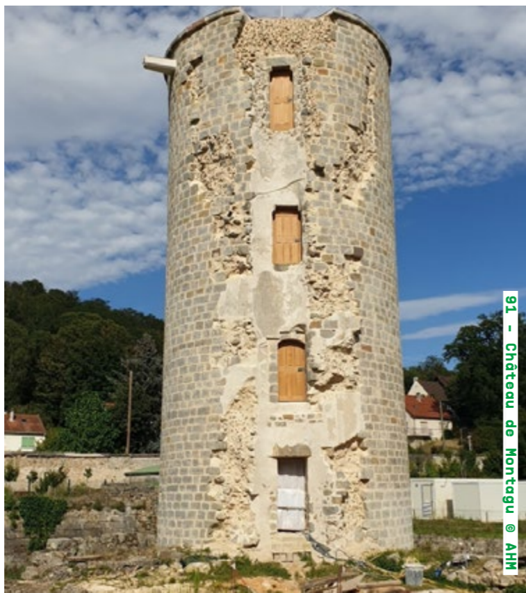
91 - Château de Montagu

Animations samedi et dimanche de 10h30 à 18h dourdan.fr Détails de la programmation ici