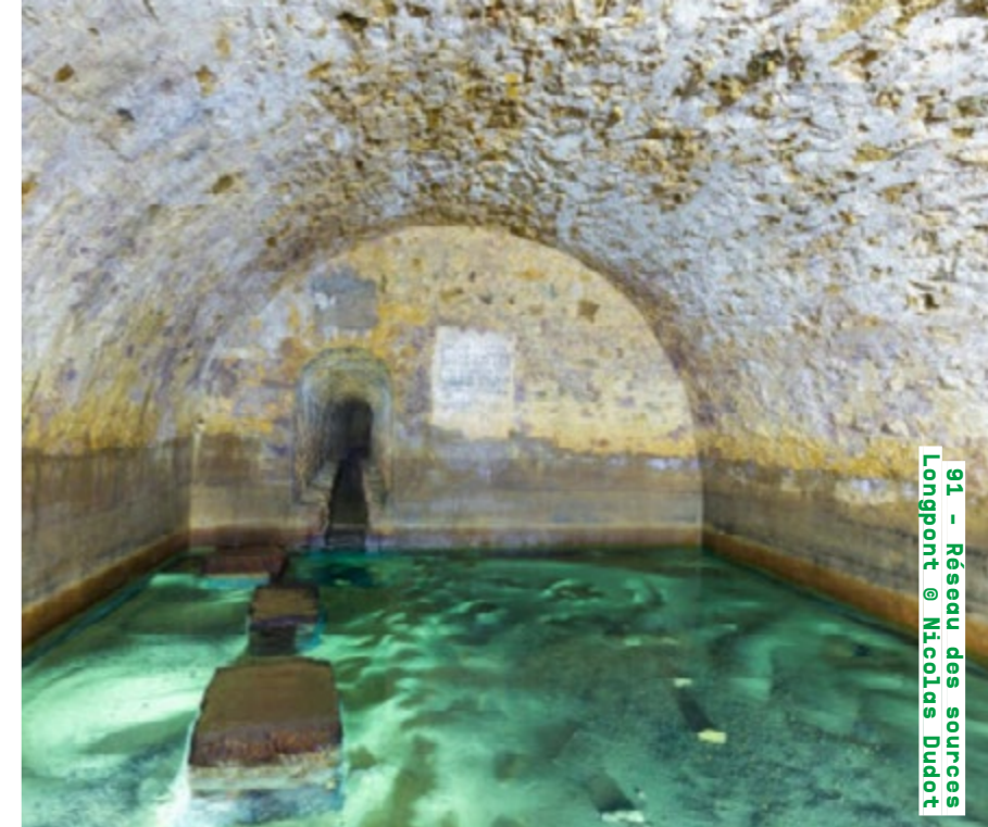
91 - Réseau des sources Longpont